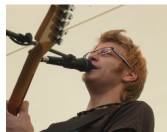
Chanteur du groupe Sage Délire

Qu'il s'agisse des micros ou des équipements de sonorisation, artistes et techniciens se sont montrés enthousiastes. La fiabilité du matériel a permis au festival de se dérouler sans qu'aucun problème vienne gêner le plaisir des spectateurs.