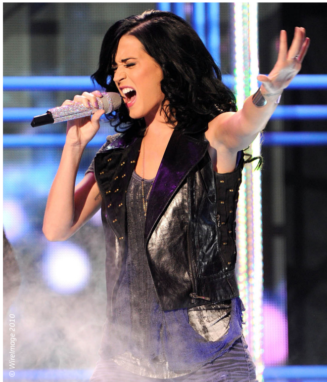
Katy Perry avec son émetteur main HF Sennheiser SKM 5200 et la capsule dynamique MD 5235.