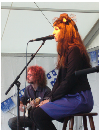
Tremplin du Festival